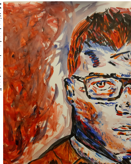
Marttus Lemba, „Isa portree“

Okasroosikese 3. korrusel punases klassis on välja pandud kunstikooli 12. klassi lõpetajate joonistamise ja maalimise eksamitööd: