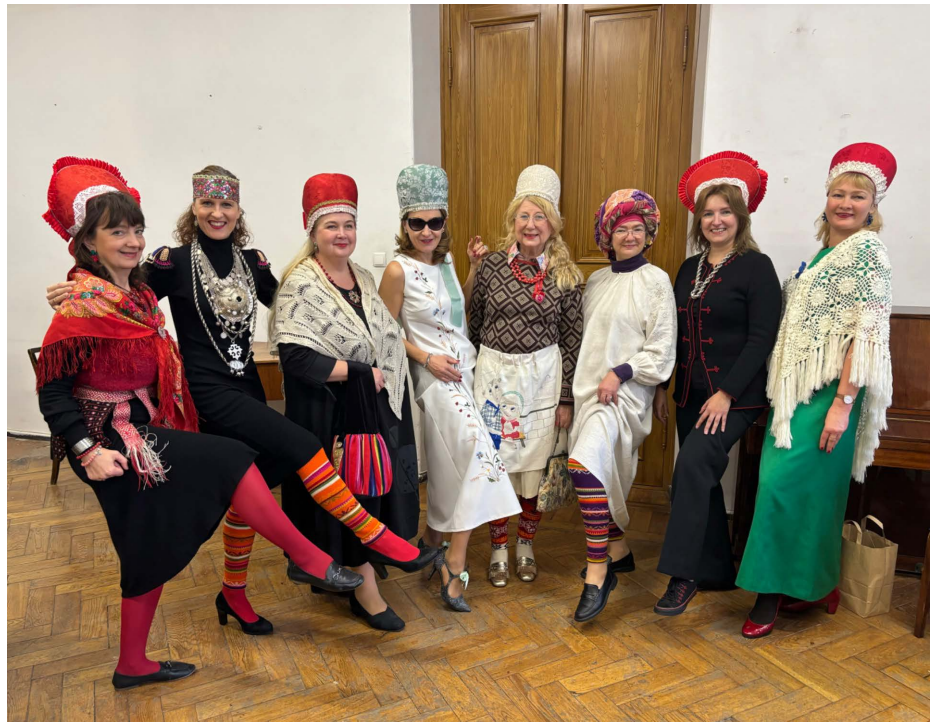
Õpetajate kollektsiooni modellid laada moe-etendusel

VHK NIGULALAADAGA teeniti 9000 eurot ning oksjoniga 4100 eurot ja ca 2000-eurone Yamaha elektriklaver. Kokku oli päeva tulu üle 15 000 euro! Sügav kumardus kõigi ees, kes selle õnnestumisele kaasa aitasid.