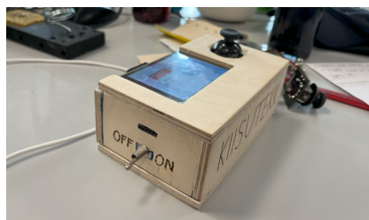
Eelvoorus valminud „Kiisutekk“

Eel- ja lõppvooru vahel oli vaid üks öö magamiseks, nii et oli algsest plaanis vähemalt finaali jooksul kasvõi tund-paar magada, aga võistlus kujunes palju pingelisemaks, kui alguses, ootasime ja unetunnid tuli ohverdada parema mängukonsooli nimel. Kogemus oli võimas ja kindlasti on plaanis osaleda ka järgmisel aastal.