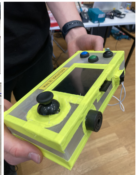
Finaalis valminud „Kiisutekk ultra“