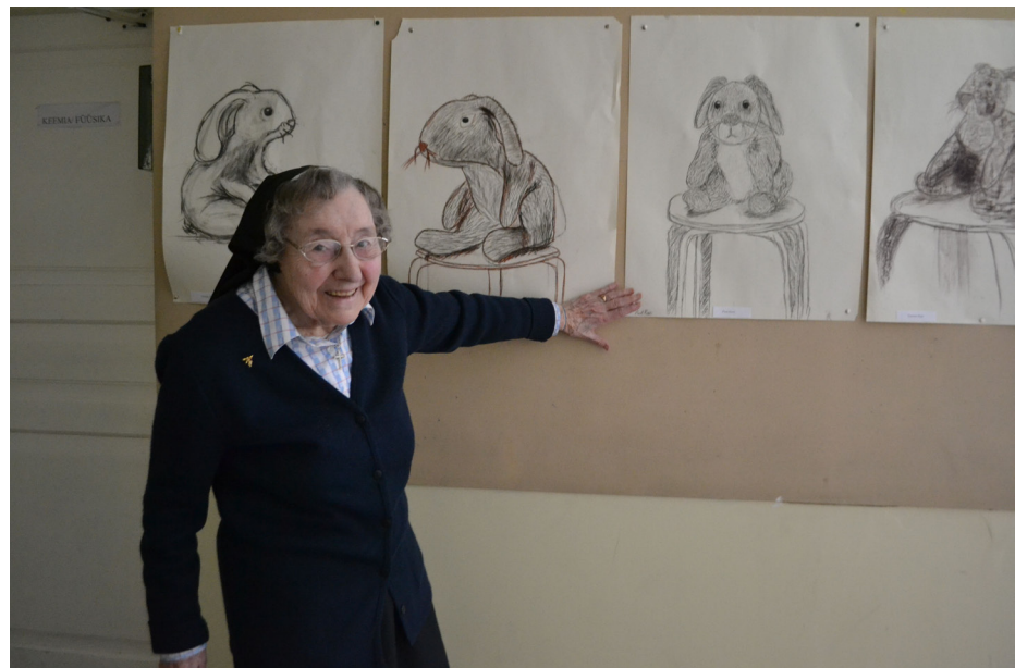
Õde Mary 90 - vt lk 3