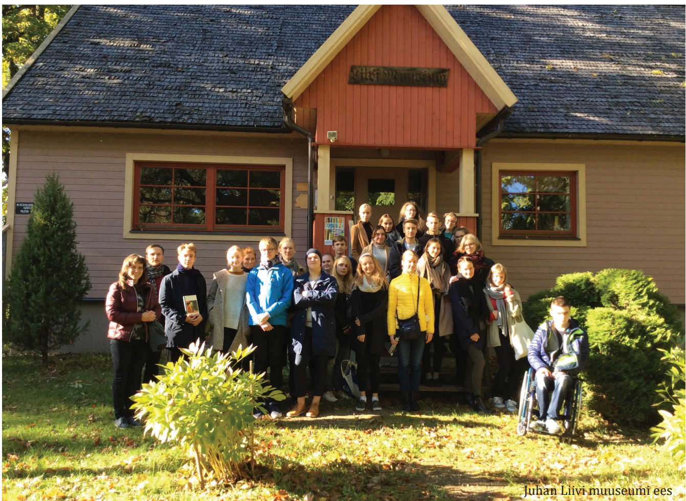
Juhan Liivi muuseumi ees