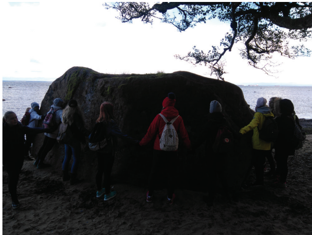
7. T ja rändrahn