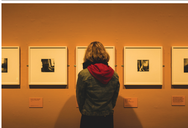
10. K ja kunst

inimestes kerget ärritust, kuid usun, et sellele vaatamata oli meie Helsingi retk siiski väga tore ja muutis meid ka klassina ühtsemaks ja lähedasemaks. Loodame, et taolisi vahvaid väljasõite tuleb klassiga veel edaspidigi!