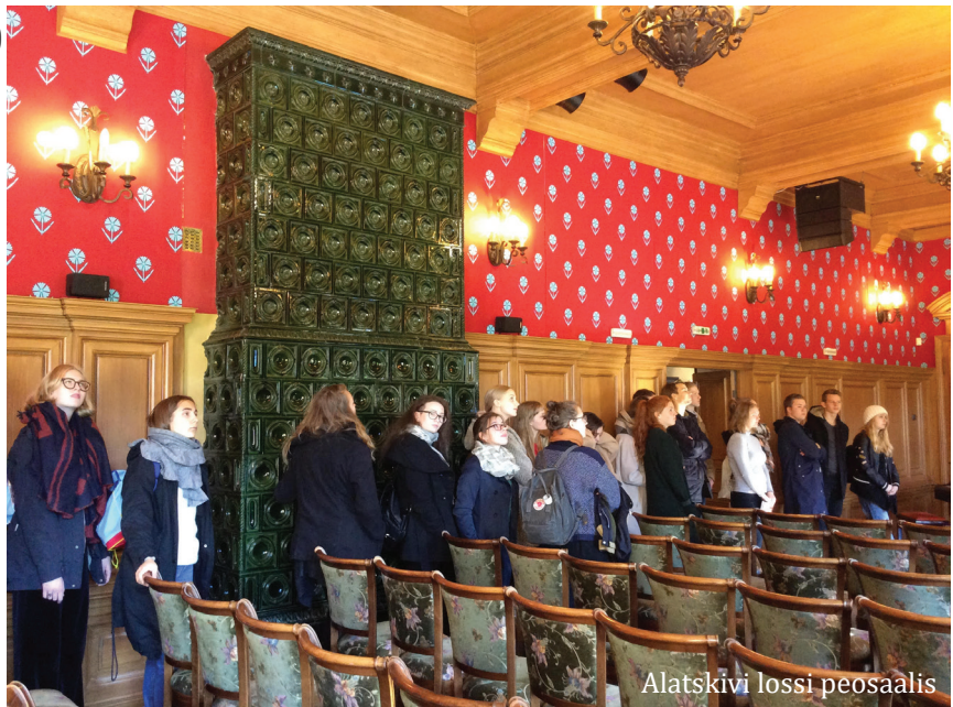
Alatskivi lossi peosaalis