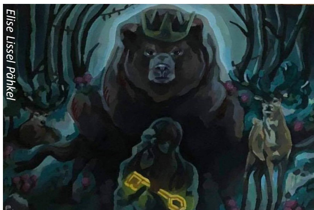
Elise Lissel Pähkel