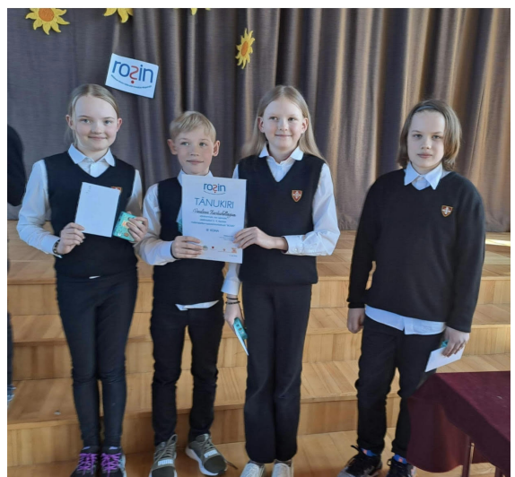
3.-4. klassi võistkond