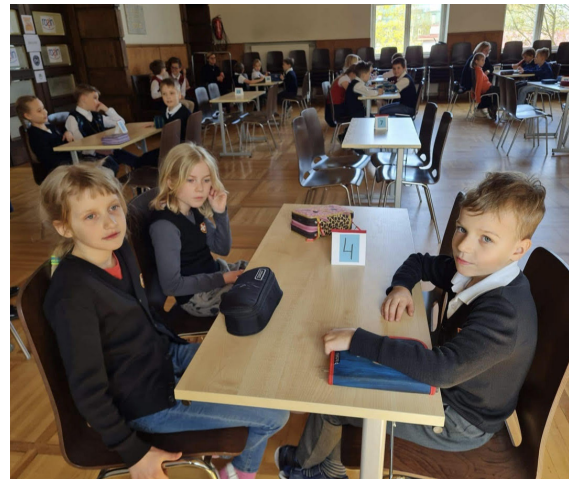
2. klassi võistkond

kell 17.30 kitarriosakonna aastakontsert Okasroosikese I korruse saalis