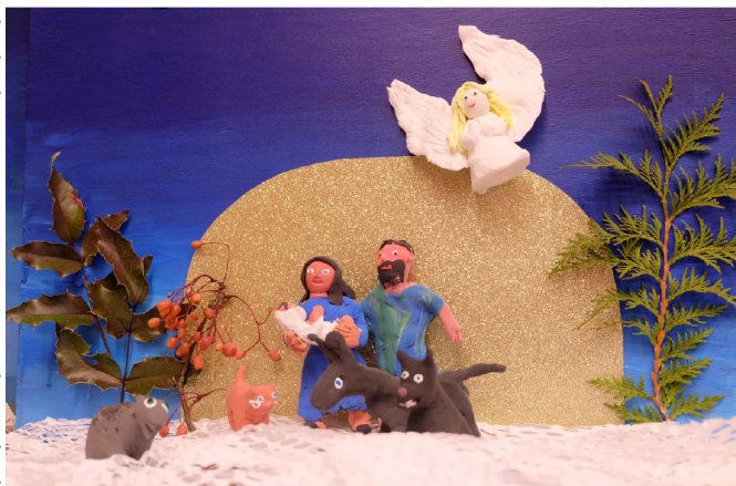
VHK 1.–3. klassi ühistöö